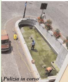
Pulizia in corso

NAVILE -LE ELEZIONI FANNO BENE ALLA FONTANA di piazza Caduti per la Libertà, oltre che alla segnaletica orizzontale con le strisce sulle strade rifatte in molte borgate. Lunedì le vasche di porta Navina hanno subito una radicale pulizia, che ha eliminato monetine, cicche di sigaretta, cucchiaini di gelato e la patina di muschio verde proliferata sul fondo.