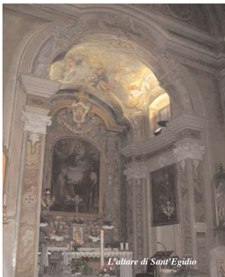
L'altare di Sant'Egidio