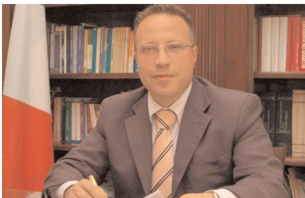
Committente: Agostino Celano

Elezioni Amministrative 27/28 maggio 2007