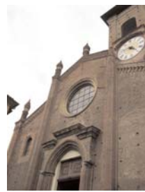
Santa Maria della Scala

Restauri per i 14 dipinti ovali della Via Crucis destinati alla Collegiata e per i due quadri d'altare di Sant'Egidio