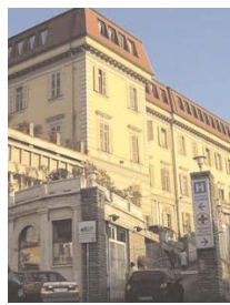
Il Santa Croce

Sulla parte destra della scheda sono raccolti