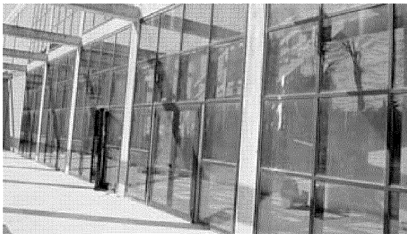
Una immagine del Teatro Dellepiane di Tortona