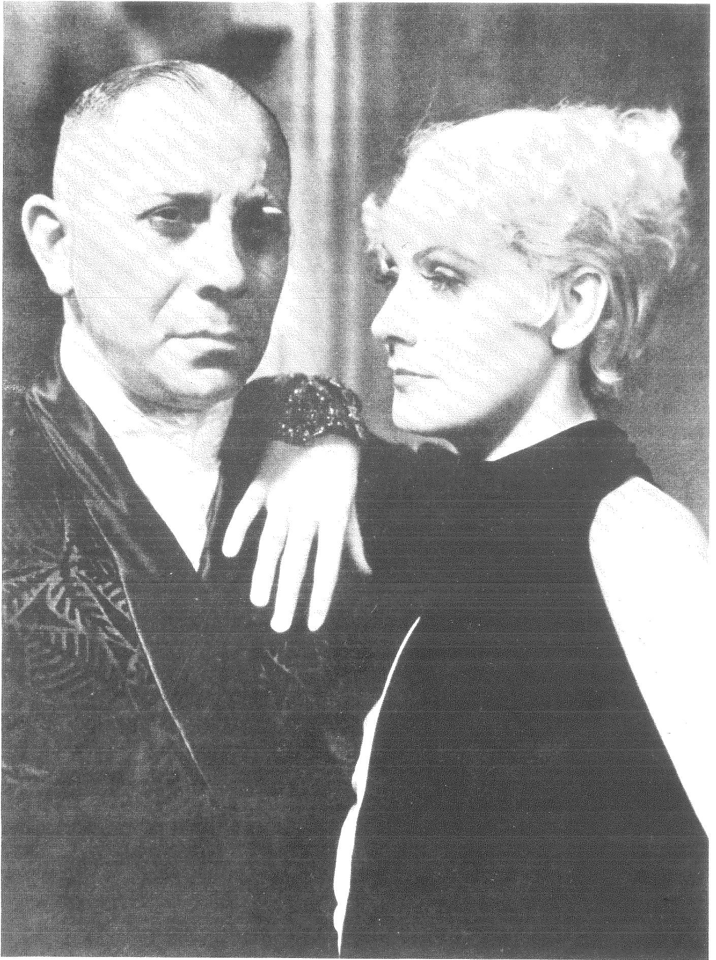
Erich von Stroheim e Greta Garbo in As you desire me ( Come tu mi vuoi ), regista G. Fitzmaurice, 1932.