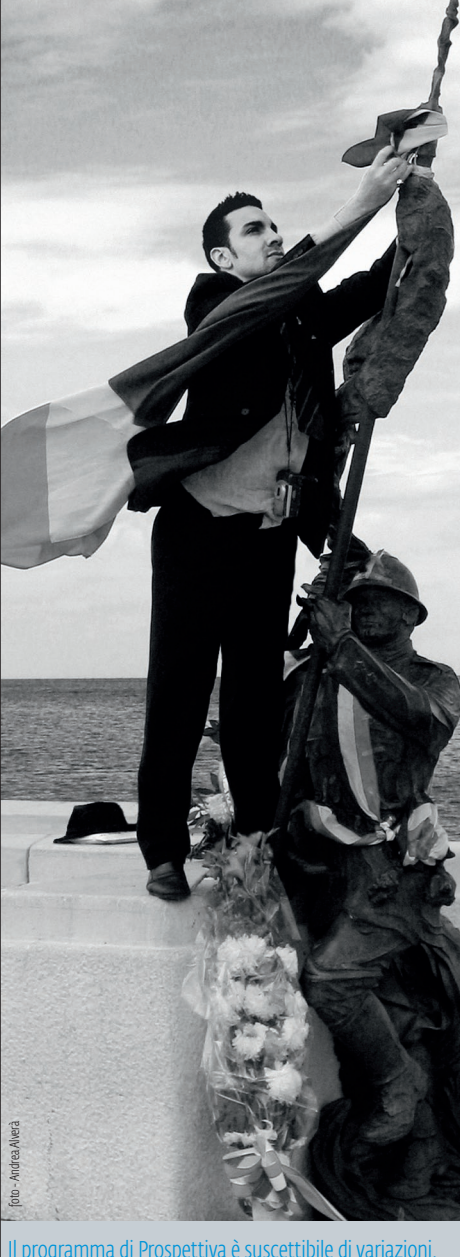
Il programma di Prospettiva è suscettibile di variazioni.