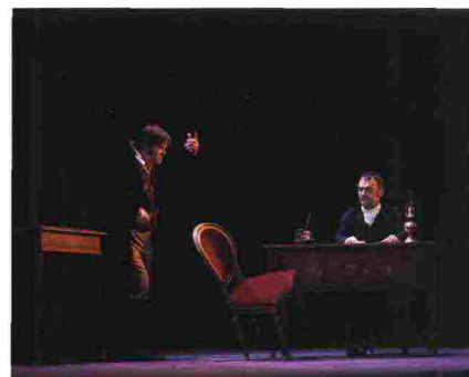
Una scena dallo spettacolo 'Morte di Danton'