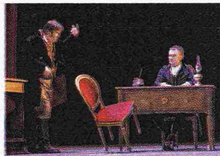
Una scena di Morte di Danton

Quando dice "Faccio quadri ma non penso a me stesso come a un pittore", Wade Guyton ci vuole dire non solo che non usa i pennelli, ma anche che il suo rapporto col digitale non è convenzionale. Tele uscite dalle stampanti, riduzioni e aumenti di risoluzione: tra pop art e arte concettuale, nella mostra "Siamo arrivati" il getto d'inchiostro, l'incepparsi della stampa e la carta riciclata usata influiscono sul lavoro dell'artista. E l'errore diventa risultato creativo. madrenapoli.it