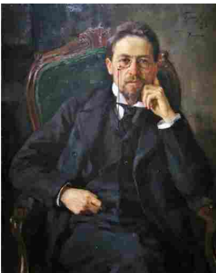
Anton Čechov in un ritratto del pittore Osip Braz