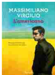
«L'americano» di Massimiliano Virgilio (Rizzoli, pp. 348, euro 19)

Ebbene, è proprio da questa Terra di Mezzo che giunge L'americano , il nuovo romanzo di Massimiliano Virgilio edito da Rizzoli in libreria da domani. Quello che Goffredo Fofi aveva già definito «il migliore scrittore napoletano in circolazione» offre qui la prova di una maturità narrativa che lo trascina definitivamente sull'attuale proscenio della letteratura italiana.