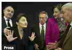
Prosa Così è (se vi pare)