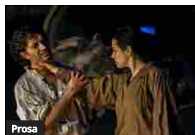
Prosa Io, Caravaggio