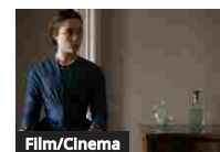
Film/Cinema She brings the rain – Dark lady di ieri e oggi