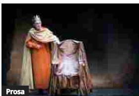
Prosa Enrico IV