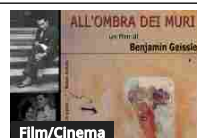
Film/Cinema All'ombra dei muri. In tutto il mondo 100 cinema ricordano Bruno...