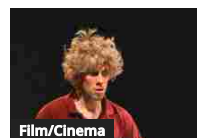
Film/Cinema Cinemat teatro 2017