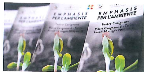
Locandine Emphasis per l'Ambiente