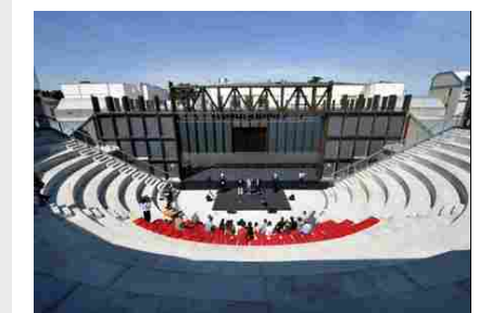
Da piscina ad Arena: la Prima Stagione estiva del Teatro Due di Parma 17 Giugno 2017

Il Teatro Grande di Pompei, scenario di rappresentazioni dal II a. C., torna ad accogliere drammi antichi. Parte il primo anno del progetto quadriennale POMPEII THEATRUM MUNDI , realizzato dalla collaborazione tra il Teatro Stabile di Napoli-Teatro Nazionale e il Parco Archeologico di Pompei. Con cinque spettacoli del mondo antico riletti da sguardi contemporanei, la tragedia torna nel suo magico scenario originario.