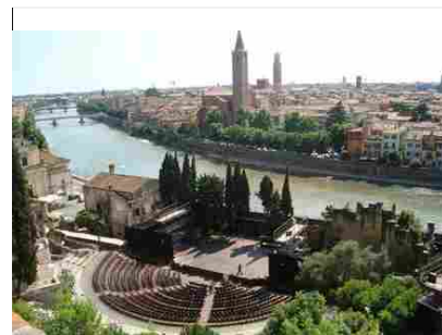
L'estate del teatro a Verona: tra Shakespeare, danza internazionale e rafting teatrale 20 Giugno 2017