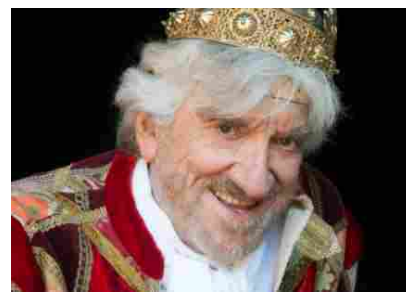
Globe Theatre 2017: debutto con il mistero di Troppu Trafficu ppi nenti 18 Giugno 2017

Si può arrivare a Pompei anche in treno. Per l'occasione l'Eav ha istituito il Treno Campania Express (con partenza da Napoli Porta Nolana e arrivo a Pompei Santuario al costo di €10 a/r) con un ritorno da Pompei Santuario alle 23,30. I biglietti sono acquistabili in prevendita presso la biglietteria EAV o si prenotano all'indirizzo pubblicita@eavsr.it . Inoltre è prevista anche una visita guidata agli scavi prima di ogni spettacolo (con un aumento del costo del biglietto di 5 euro) con prenotazione obbligatoria all'indirizzo promotion.pompei@teatrostabilenapoli.it . L'iniziativa nasce in collaborazione con Campania Arte Card .