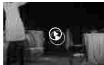
L'amante di Harold Pinter