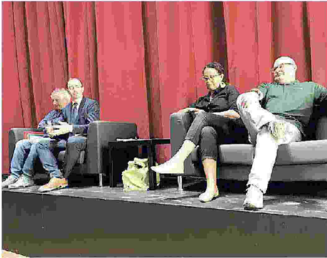
La presentazione del cartellone