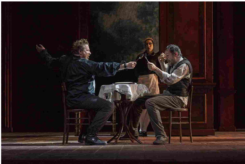
Don Giovanni