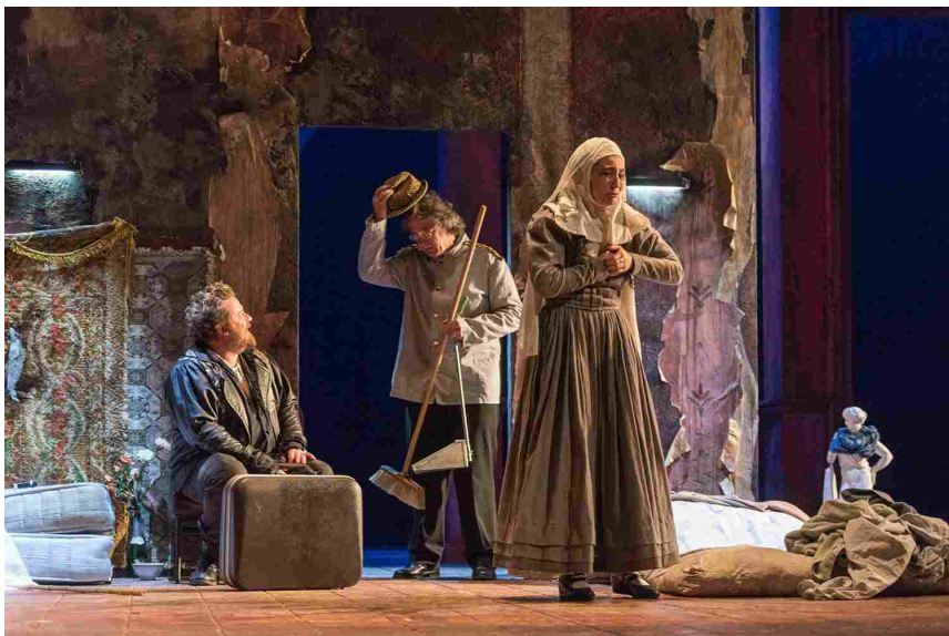
Don Giovanni

Esatto. Il mio tentativo è quello di rendere lo spettacolo comprensibile e godibile. E credo che il compito del teatro, in definitiva, sia quello di commuovere e divertire. È necessario recuperare un rapporto viscerale e sensuale con l'antica favola del teatro, che trova compimento in un'epoca passata, dove i testi erano pensati in rapporto a un'incredibile fiducia nel teatro come festa dell'umanità. Il teatro contemporaneo, in qualche modo, ha sempre desiderato guastarla questa festa. Senza nulla togliere all'immensa potenza poetica di certi autori, io mi sono un po' stufato di vivere nella luttuosa poesia dell'impossibilità: ho voglia di raccontare favole che parlano con energia e passione e questo linguaggio io lo trovo nei classici.