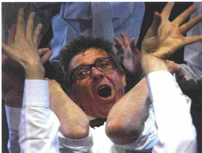
'Lear, schiavo d'amore', ©MicheleTomaiuoli

Per tutte le date: www.teatrostabiletorino.it