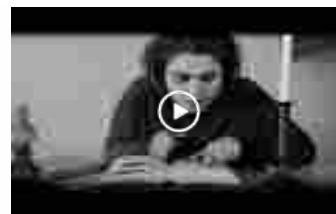
Otto pericolose simpatiche donnette