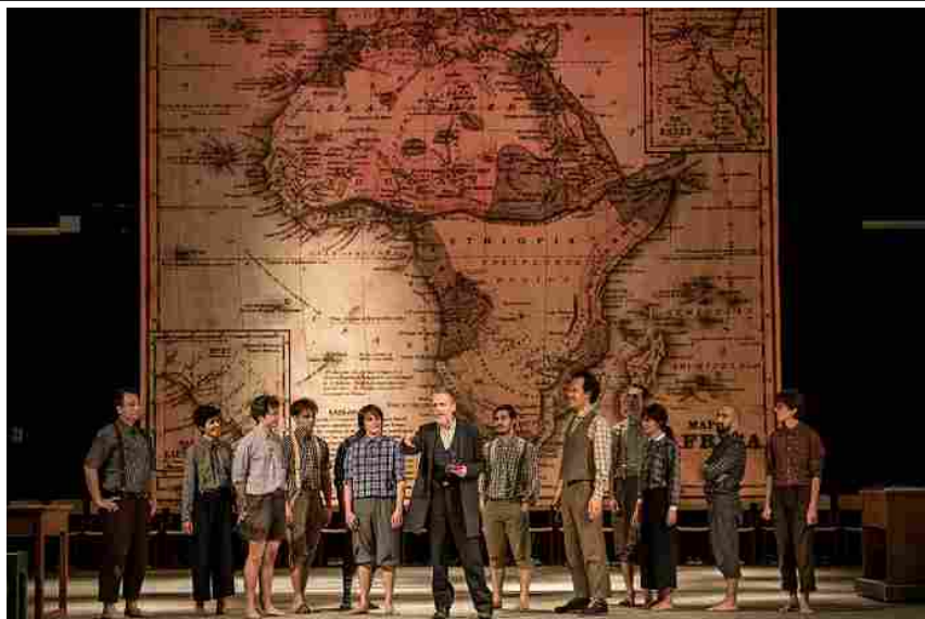
Ferrini in Tenebra

La transizione da De Amicis a Conrad avviene ancora in una situazione scolastica: una lezione d'aula dominata da una grande mappa d'epoca del continente africano.