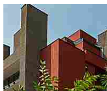
La casa dei tuoi