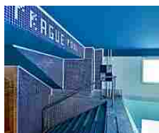
City break fuori