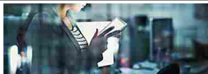
Settore energetico: nuovi modelli di business con le tecnologie digitali

Appuntamento alle Fonderie Limone, Moncalieri, d omani, 30 novembre, e sabato 1 dicembre alle 20,45