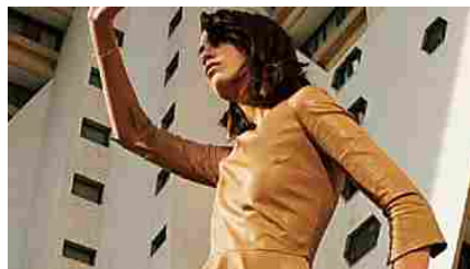
La moda è in evoluzione. Rinnova il tuo stile con Imperial.