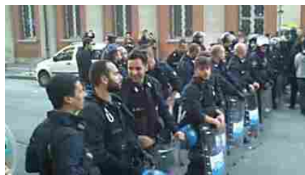
La polizia blocca corteo anti-Salvini: replica lascia gli agenti senza parole