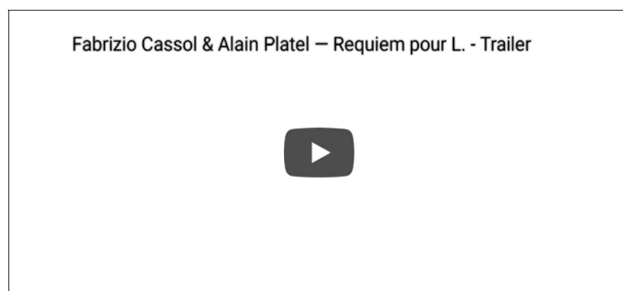
Foto: Requiem pour L. di Fabrizio Cassol e Alain Platel, les ballets C de la B, ph. Chris Van der Burght.