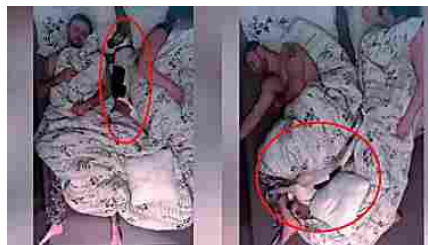
Una coppia dorme con il cane nel letto, ecco la loro notte in 40 secondi