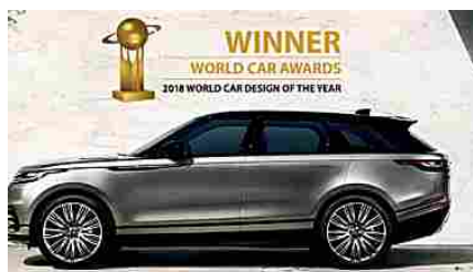
Range Rover Velar con Land Rover FULL JUMP! Scopri di più.