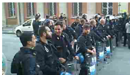
La polizia blocca corteo anti-Salvini: replica lascia gli agenti senza parole