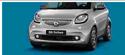
smart EQ fortwo con un'offerta elettrizzante. Scopri di più.