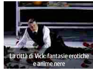
La città di Vick: fantasie erotiche e anime nere