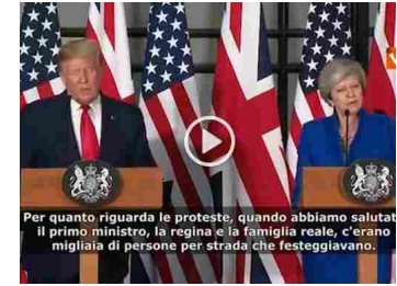
Per quanto riguarda le proteste, quando abbiamo salutato il primo ministro, la regina e la famiglia reale, c'erano migliaia di persone per strada che festeggiavano.

Trump a Londra: «Proteste contro di me, solo fake news»