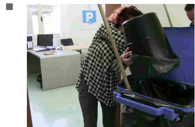
Costretti a lavorare un'ora al giorno e a rovistare nei cass...