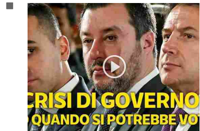
Crisi di governo, ecco quando si potrebbe votare