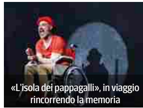
«L'isola dei pappagalli», in viaggio rincorrendo la memoria