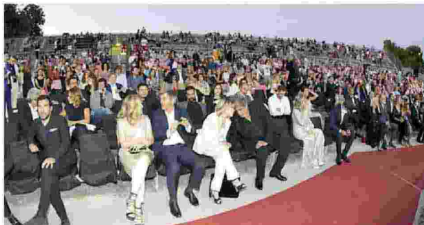
La platea dei Premi Flaiano nel Teatro D'Annunzio di Pescara