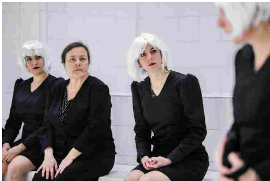
La casa di Bernarda Alba

Anche Fausto Paravidino si ispira a uno dei grandi maestri del Novecento, Bertolt Brecht , proponendo Peachum ( Info e Date ), una riscrittura dell' Opera da tre soldi , che lo vede protagonista in scena con Rocco Papaleo .