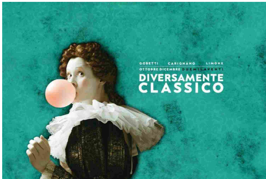
Teatro Stabile di Torino

Scritto da Roberto Mazzone | Oct 05, 2020 | Torino | 39