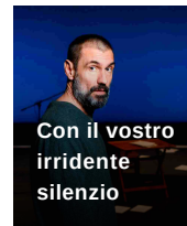
Con il vostro irridente silenzio Piccolo Teatro - Teatro Grassi Milano (MI)