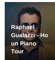
Raphael Gualazzi - Ho un Piano Tour degli Arcimboldi Milano (MI)