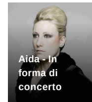
Aida - In forma di concerto Teatro Alla Scala Milano (MI)