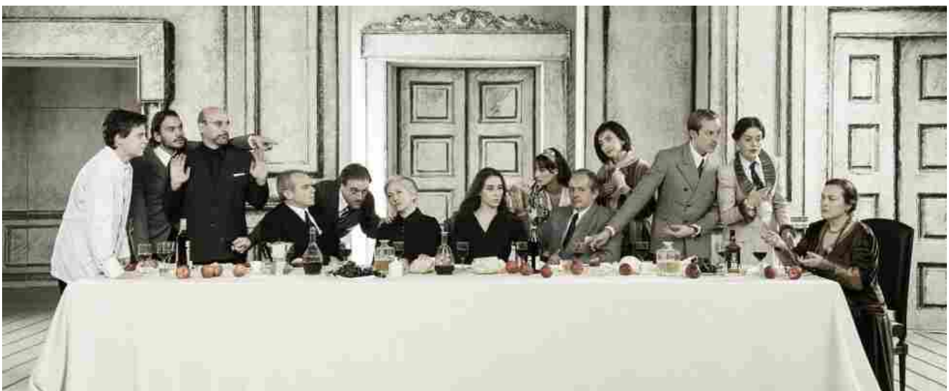
'Così è (se vi pare)'