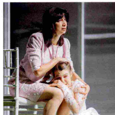
Alcune scene durante le prove dello spettacolo Molto rumore per nulla