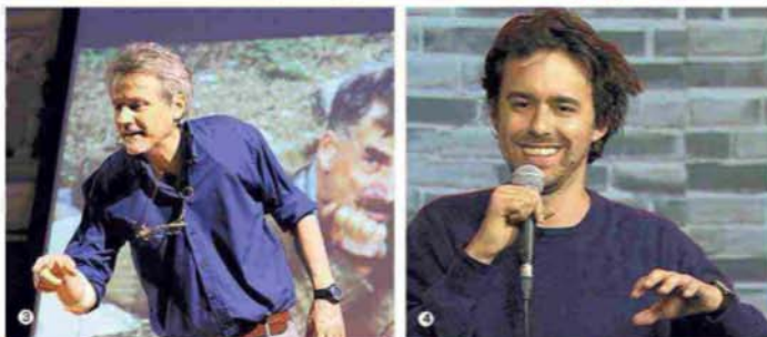
1. Un momento dello spettacolo "Buon Appetito". 2. L'attore Pino Insegno. 3. Marco Albino Ferrari propone "Freney '61. Sessanta anni dopo" un racconto in forma di monologo. 4. Luca Ravenna inaugurerà "Spaghetti Comedy, Stand up all'italiana Vol. 1". 5. I ballerini della EgriBiancoDanza