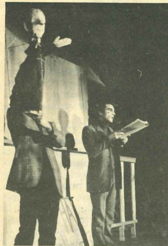
Una scena di Un nome così grande .

Prima di concludere, a titolo informativo mi sembra necessario aggiungere alcune note. Abbiamo lavorato in quattro quartieri (Corso Taranto, Mirafiori Sud, La Falchera, Le Vallette), attraverso continue riunioni con gli attivi di quartiere, insieme ai quali abbiamo scelto i temi e discusso i montaggi che venivano preparando. La stesura finale è stata preparata da me in base alle indicazioni, alle discussioni e alle ricerche compiute insieme agli attivi di quartiere (e sulle dif-