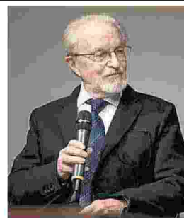
ELVIO FASSONE EX MAGISTRATO POLITICO E SCRITTORE