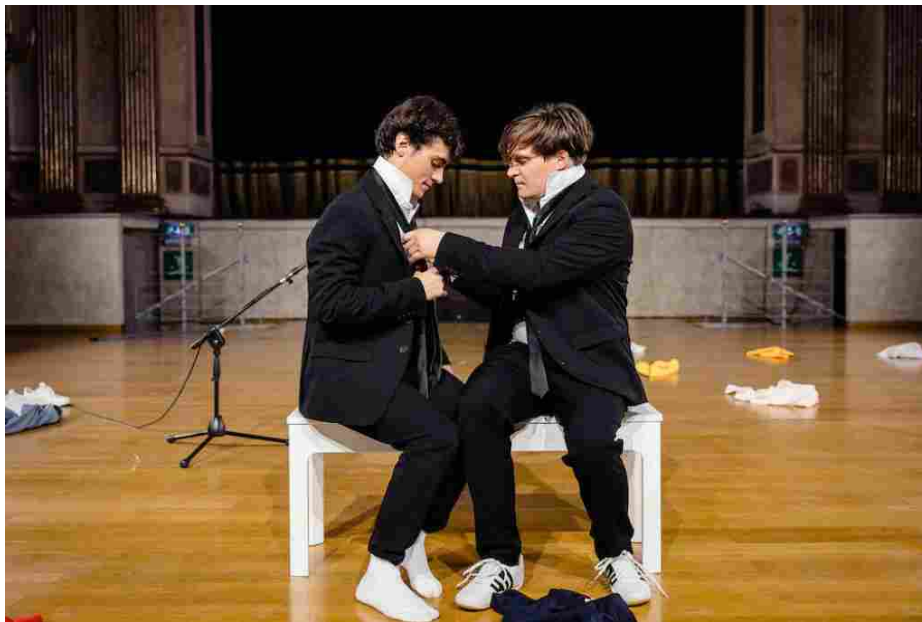
"Come nei giorni migliori", regia Leonardo Lidi . Foto Luigi De Palma

Lunedì, 22 Maggio 2023 | Scritto da Giovanni Luca Montanino | dimensione font | Stampa | Email