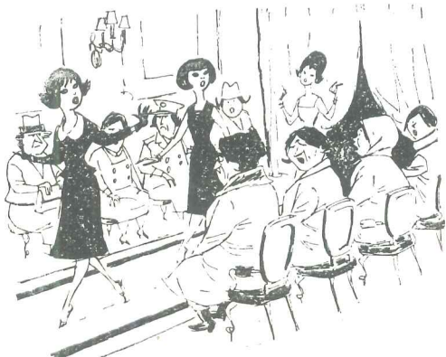
En Moscú se realizó una demostración de la moda occidental. "¿Qué te parece esta línea Dior?" "La prefiero a la línea marxista-leninista".

En menos de cincuenta años, en el lapso de una vida humana, también la cirugía ha recorrido tanto camino que vuelve difícil una definición actualizada. Tanto más si consideramos la visión prodigiosa, el formidable esfuerzo de este último decenio hacia la conquista del trasplante de órganos, que va a abrir una grande y nueva era de la medicina y la cirugía. El profesor Biancalana ha admitido que aún no es posible prever cuándo se podrán sustituir órganos enfermos por otros sanos, pero está convencido de que se trata de una eventualidad segura y sin duda próxima. En los últimos tiempos se ha demostrado la posibilidad de mantener en vida al cerebro aislado. Si en el futuro se llega a injertar una parte de cerebro, ¿qué será de la personalidad humana? Algunos piensan que en las células nerviosas está escrito todo sobre nosotros, y que el pensamiento es una secreción del cerebro. "Nos estamos acercando al límite del conocimiento —ha declarado el ilustre cirujano— a las fronteras del misterio de la vida y de la muerte." En cuanto al arte de la cirugía, el profesor Biancalana ha pronun-