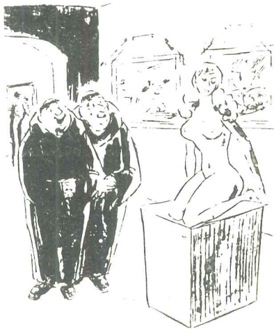
Arte naturalista moderno. Un fraile a su compañero: "No tengo la más lejana idea de lo que puede representar, pero no está mal".

El "mal del azúcar", crónico y muy difundido, tiene notable importancia social. Actualmente, después de las investigaciones de los doctores Bufano y Pío Bastai, la diabetes puede ser tratada en forma excelente, tornando la vida del paciente completamente igual a la del individuo sano. Pero es necesario que